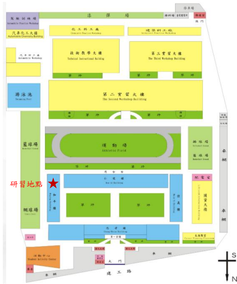
圖2 研習場地理位置圖