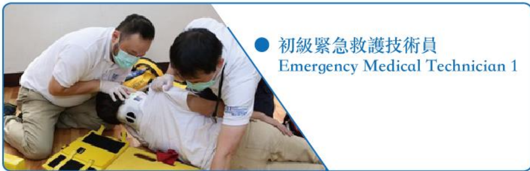
● 初級緊急救護技術員 Emergency Medical Technician 1