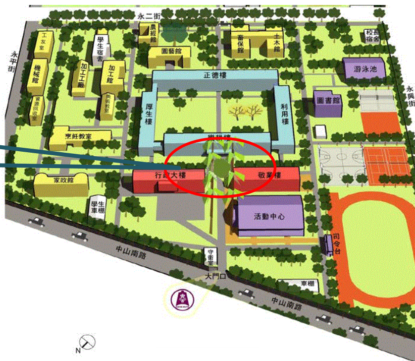
國立台南大學附中 研習場地位置圖