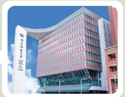
▲ 南臺科技大學大門照