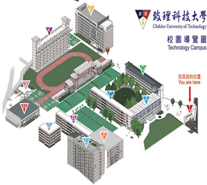
圖 1 校園導覽圖