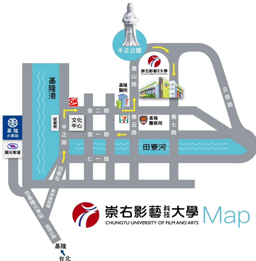
附件 8：崇右影藝科技大學位置圖