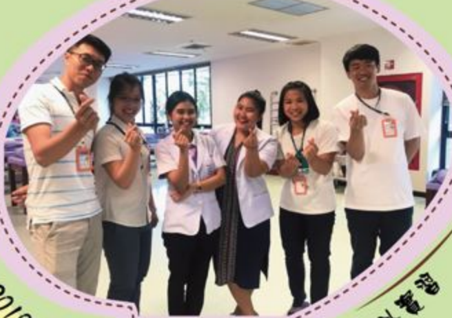
2018年本系學生赴泰國馬希賓大學海外實習